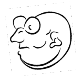
myš/ muž s okuliarmi