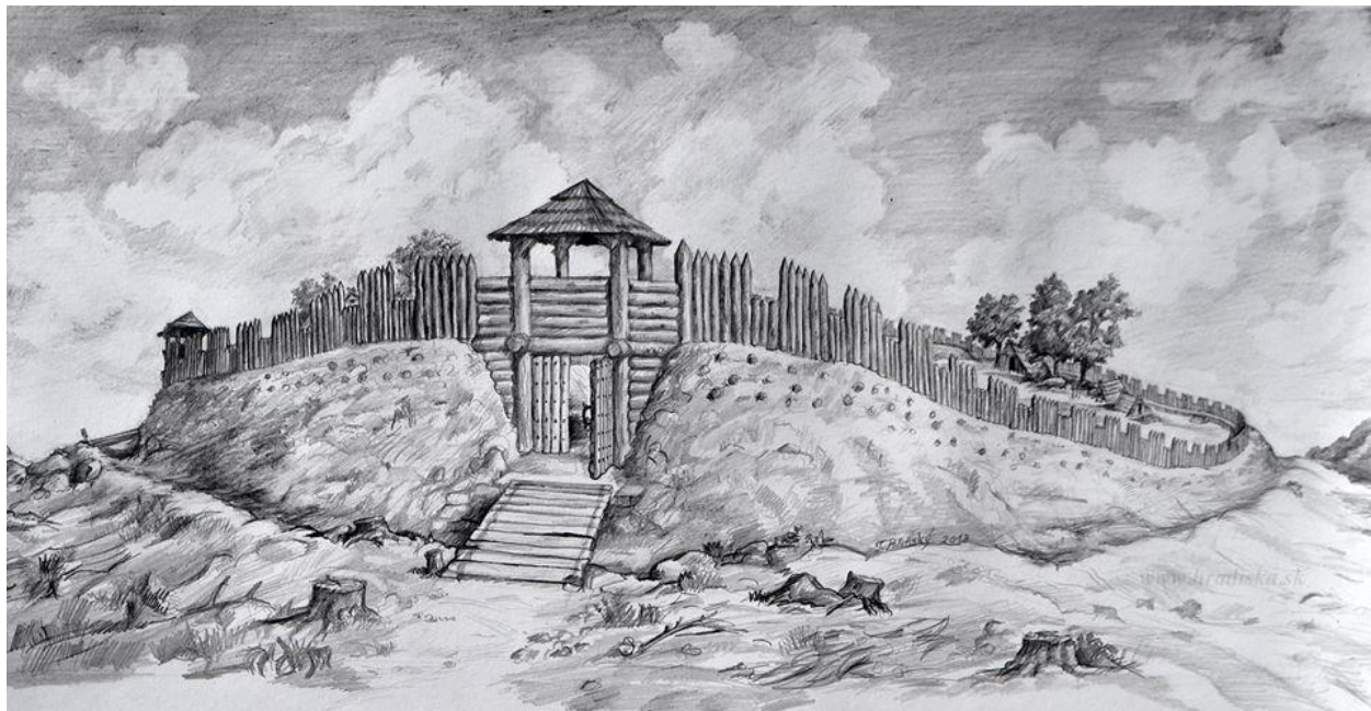
Staroveké hradiská- Modra